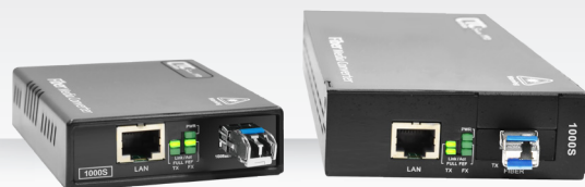
( 外接電源 )